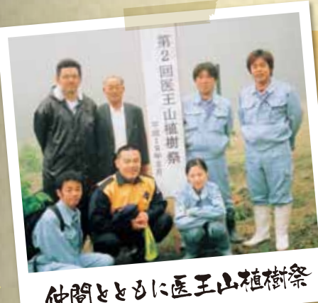
仲間とともに医王山植樹祭

3歳過がき時代 養子入り/8歳の決断! 田舎の農家の3男は、将来に展望は薄い。親戚に望まれて養子になるならば、一つの選択肢。それを決断したのは小学校2年生。そして、小学校3年生になるときに、金沢の馳家に養子に入りました。初めて観る信号機や横断陸橋や電車の踏み切りに、びっくりしました!