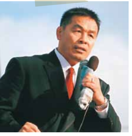
今日もどこかで街頭演説