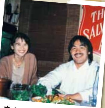
妻と二人で(結婚中)