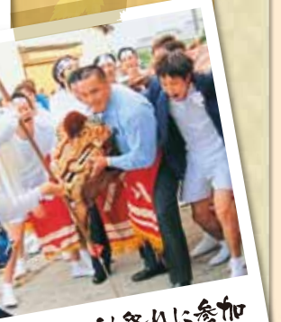
八田町の社祭りに参加