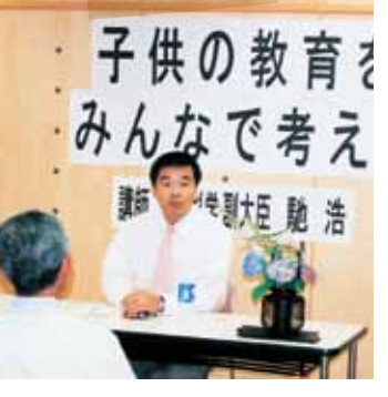
副大臣時代の講演会