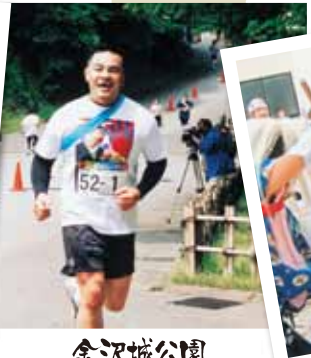
金沢城公園 リレーマラソン大会