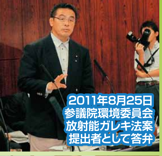
2011年8月25日 参議院環境委員会 放射能ガレキ法案 提出者として答弁