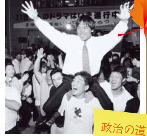
参院選石川選挙区 初当選

1995年7月、異色の経歴をひっさげ第17回参議院議員通常選挙石川県選挙区より自民党の推薦を受け出馬、現職候補との激しい選挙戦の末、無所属から初当選。後に自民党入党。