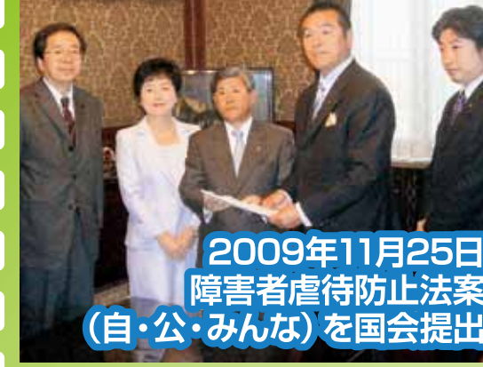
2009年11月25日 障害者虐待防止法案 (自・公・みんな)を国会提出