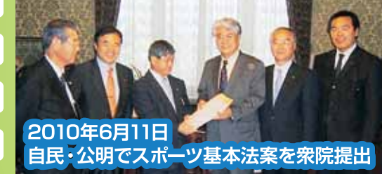
2010年6月11日 本会議で 自民・公明でスポーツ基本法案を衆院提出