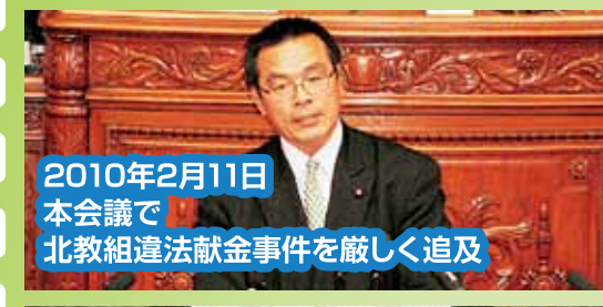
2010年2月11日 本会議で 北教組違法献金事件を厳しく追及