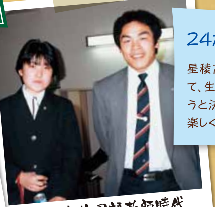
星稜高校国語教師時代 教え子と

23歳/ 全日本選手権初優勝 ロス五輪日本代表決定! 五輪出場決定、日本の頂点を極める! 流した汗は裏切らないことを実感する。