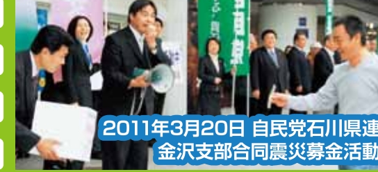
2011年3月20日 自民党石川県連 金沢支部合同震災募金活動