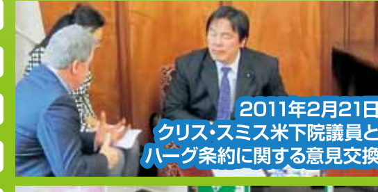
2011年2月21日 クリス・スミス米下院議員と ハーグ条約に関する意見交換