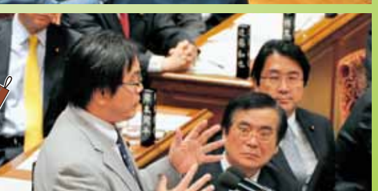
2012年3月1日 衆院予算委員会 野田内閣追及