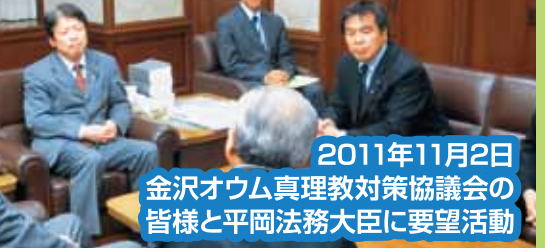
2011年11月2日 金沢オウム真理教対策協議会の 皆様と平岡法務大臣に要望活動