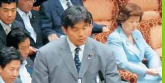
2012年7月18日 参院委員会にて 社会保障と税一体改革 関連3法案の修正案 提案者として閣僚席で答弁